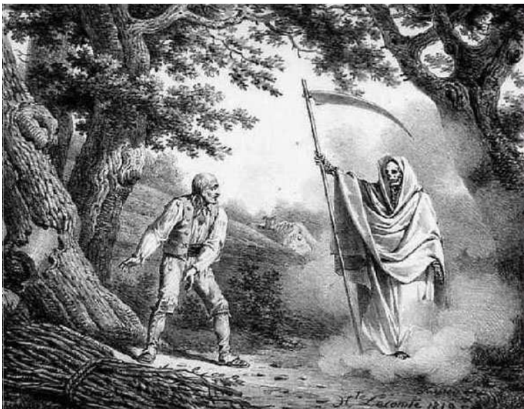
La mort et le bûcheron, d'Hippolyte Lecomte

Al remat caigüe, i veent-se de sort que a penes alçar-se ya podia, cridava en colerica porfia una, dos i tres voltes a la Mort.