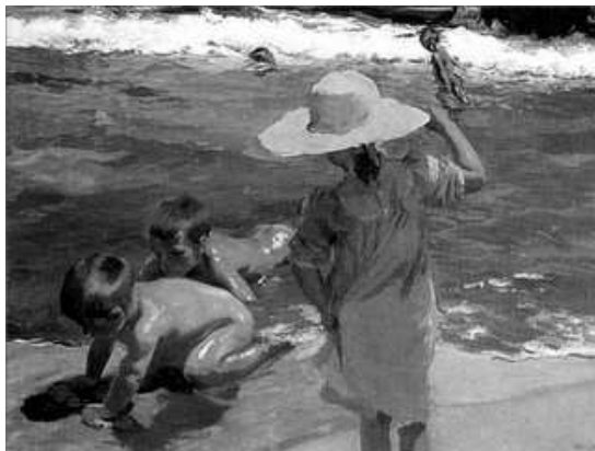
CHIQUETS A LA VORA DE LA MAR, JOAQUIM SOROLLA

¡Quins temps aquells en els que els joguets no se compraven en els grans magatzams i no feya falta posar-los bateries!