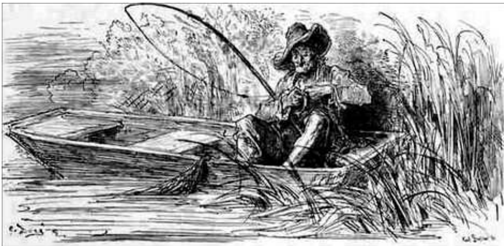
Le petit poisson et le pêcheur, de Gustau Doré

Traduccio i adaptacio a la llengua valenciana d'una faula de Felix Maria Samaniego