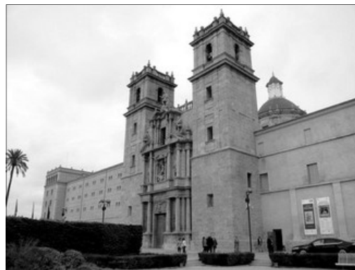
MONASTERI DE SANT MIQUEL I ELS REIS