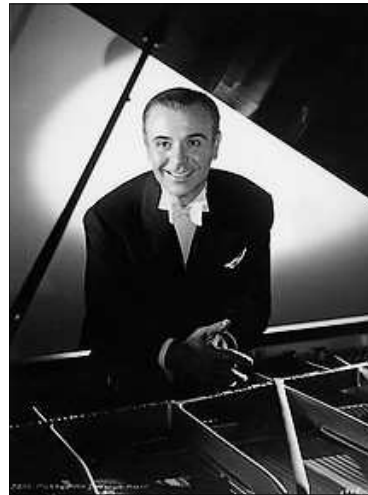
EL PIANISTE JOSÉ ITURBI

En abril de 1949 Valencia el reclama per a que done alguns recitals dirigint l'Orquestra Municipal de la ciutat i recolzar aixina el seu ascens. Fon l'inici d'una llarga etapa en la que Iturbi compartirà escenari en la Orquestra de Valencia (maig 1948 - novem-