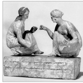
DONES JUGANT A LES TABES. POLICLET (s. V a.C)

Arreplegar: Esta es l'última jugada i guanya el primer que l'acaba. Com el seu nom indica consistix en arreplegar les cinc tabes en un sol llançament de la pilota.