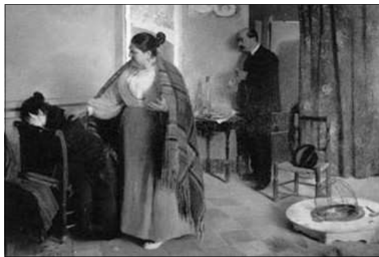
LA BESTIA HUMANA

S'ha d'insistir en l'aspecte singular de la pintura de Fillol, que en