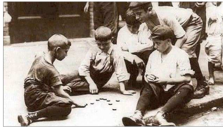
CHIQUETS JUGANT A LES CHAPES EN NOVA YORK EN 1909

Guanya qui queda l'últim dins del rogle.