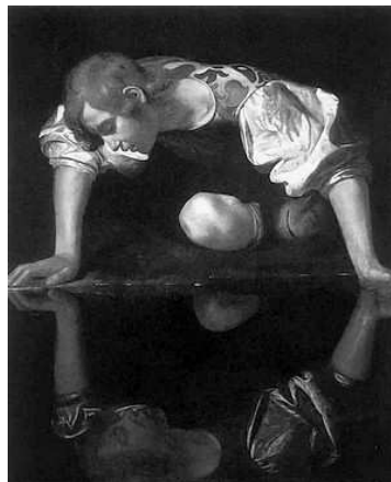
Narcis, de Caravaggio

ell —contestaren—, al cap i a la fi, encara que nosatres corregerem darrere d'ell pel bosc, tu fores l'unic que tingue l'oportunitat de contemplar de prop la seua bellea.