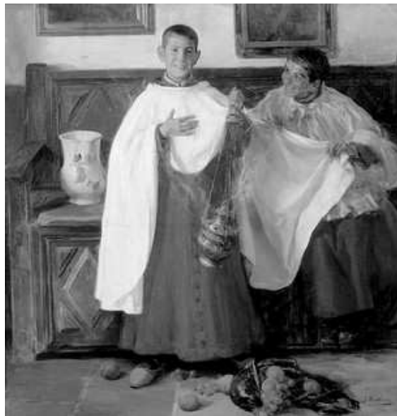
Escolanets, de Josep Benlliure

L' escolà , que ho sent, contesta: "Casada"