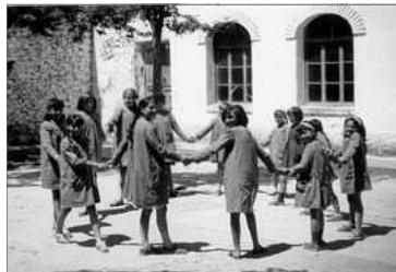
CHIQUETES JUGANT FENT UN ROGLE