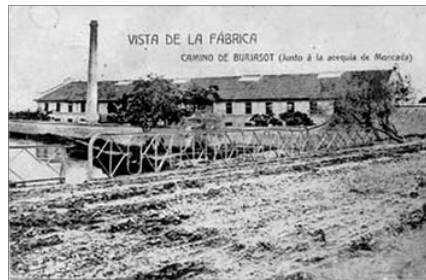
FABRICA DE TEIXITS DE SEDA MIRALLES. BURJASSOT

El programa d'esta commemoració contempla l'unió dels països més representatius relacionats en l'orige i el comerç de la seda. Este corredor d'idees i coneiximents es una de les grans fites de l'història de la civilització que l'Unesco vol preservar. La ruta arranca en Xian (quilòmetre zero del recorregut), ciutat xinenca que fon el lloc en el qual, el maig de l'any passat, se celebraria el primer encontre del programa de la Ruta de la Seda. En esta reunió, el nostre Estat, a petició de Valencia,