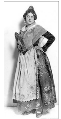
PEPITA SAMPER, MISS ESPANYA 1929, VESTINT EL TRAJE DE LLAURADORA, DE SEDA

De tots els actes programats destaquen els dos encontres auspicats per l'Unesco que tindran lloc en Valencia. El primer d'ells, una reunió preparatòria de l'òrgue directiu de la Ruta de la Seda, que està previst se celebre del 17 al 19 de març, coincidint en la festa de les Falles ; festa candidata a Patrimoni de l'Humanitat i relacionada en este event per la revalorisació i vigència de la seda en l'indumentaria dels trages típics valencians. L'atre es el II Encontre Internacional , que se desenvoluparà del 9 al 12 de juny en la participació dels representants de tots els països integrants de la Ruta.