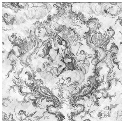
ALEGORIA DE LA FAMA. PAVIMENT DEL SALO D'ACTES

A banda de l'excel·lent col·lecció de teixits i l'extraordinària decoració de l'edifici, l'institució posseix l'archiu gremial més important de Europa ; consta de 48 pergamins, 660 llibres i 97 caixes d'archiu, en els que s'arreglegen cinc segles d'història.