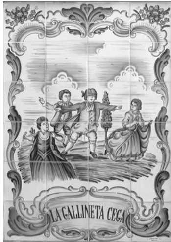
RAJOLAS "LA GALLINETA CEGA". JARDI EL BOSCANY, MANISES

Llavors, si endivina qui es, este paga, i tornen a escomençar. Si no endevina de qui es tracta continúa buscant.