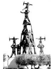
MONUMENT A LA MOIXARANGA. ALGEMESI

Conta la tradicio i devocio popular que l'imatge fon trobada en el tronc d'una morera en 1247 i es te idea que, des de llavors, s'organisaven festes en el seu honor. Mes tardanament hi ha noticia de l'existencia de la Capella de la Troballa. La constancia de la celebracio festiva s'arregla en un document de 1610, en el qual es quantifiquen les despeses de la festa, la qual es fara general i s'instituirà molt probablement a partir de 1747.