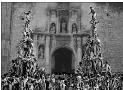
LES ALTES A LA PORTA DE LA BASILICA

La Moixaranga es un conjunt de figures o quadros plasticos que es representen en motiu de les festes majors d'Algemesi, i que esta localitat de La Ribera dedica a la Mare de Deu de la Salut. Estes figures es van construir pels moixaranguers -una important colla d'homens de les mes diverses edats- al compas i cadencia d'una musica que