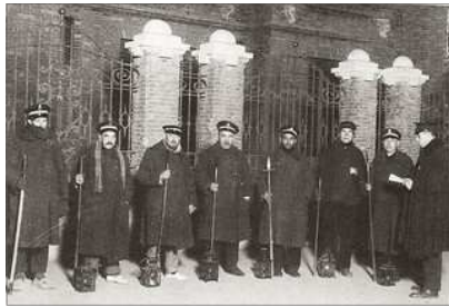
GRUP DE SERENOS

Cada sereno, en el Cap i Casal , tenia a les seues ordens a quatre vigilants. Era tranquilisador sentir el tintineig de les claus dels portals que, al crit de "¡Serenoooo!" o a les palmes dels veïns, feen sonar al crit de "¡Vaaaaaig!".