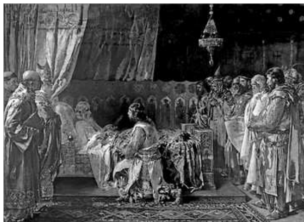
ULTIMS MOMENTS DEL REI JAUME EL CONQUISTADOR EN L'ACTE D'ENTREGA DE LA SEUA ESPASA A SON FILL EN PERE, IGNACI PINAZO

En Roma havia començat a abandonar l'estil academiciste i els temes de genero, historics, classics..., iniciant una llinea pictorica mes intima i personal, tractant temes familiars, escenes de nus i de la vida quotidiana i adoptant definitivament l'estil impressioniste, sent u dels primers representants espanyols d'esta corrent i constituint una influencia decisiva en l'obra de Joaquim Sorolla i de Francesc Domingo , tant en l'estil com en la tematica costumista valenciana.