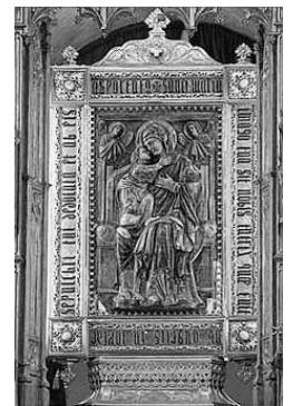
IMAGE DE LA MARE DE DEU DEL PUIG EN L'ALTAR DE L'IGLESIA

Una bonica llegenda envolta esta advocacio. Se conta que una nit en que l'exercit jaumi estava acampat a l'entorn del llavors nomenat Puig de Cebolla , els soldats que estaven de guardia veren com caïen unes estreles del cel a un punt concret, prop del campament. Alertats, avisaren al rei. Una versio molt mes estesa diu que fon sant Pere Nolasc , fundador de la Orde de la Merce , que assistia i acompanyava a les tropes cristianes, qui, mentres orava, va vore caure set estreles en un lloc proxim. S'ordenà escarvar en aquell punt i, al poc, un so metallic feu presagiar una troballa. Efectivament, d'un objecte de metal