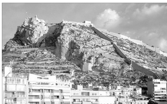
EL CASTELL DE SANTA BARBERA DOMINANT LA CIUTAT D'ALACANT

El Benacantil , montanya que domina la frontera urbana d'Alacant, constituïx l'estampa mes característica d'esta capital que s'esten, a la vora de la Mediterranea , sobre la seua falda; esta circumstancia fa que el traçat urba presente grans desnivells. L'Ajuntament està a zero metres sobre el nivell de la mar, punt que se pren com a referencia per a calcular l'altitud de qualsevol punt i elevació d'Espanya. Des d'un angul concret, l'imatge que oferix el massiç del Benacantil se pot interpretar com un rostre, nomenat popularment com la Cara del Moro , peculiaritat que s'ha convertit en un referent caracteristic de la ciutat.