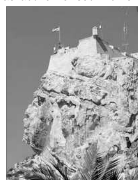
CARA DEL MORO

a 1963 en que se'n obri al public. Per a pujar a visitar-lo hi ha dos ascensors, inaugurats eixe any, que fan un recorregut per dins de la montanya de 142,70 metres i als que se pot accedir per un pas subterraneu de doscents metres de llargaria que naix en l'avinguda Jovellanos , front a la plaça del Postiguete . L'acces tambe pot fer-se a peu, en autobus o en coche per una carretera convencional en la cara nord del Benacantil, la qual te el seu inici en el carrer Vázquez de Mella .