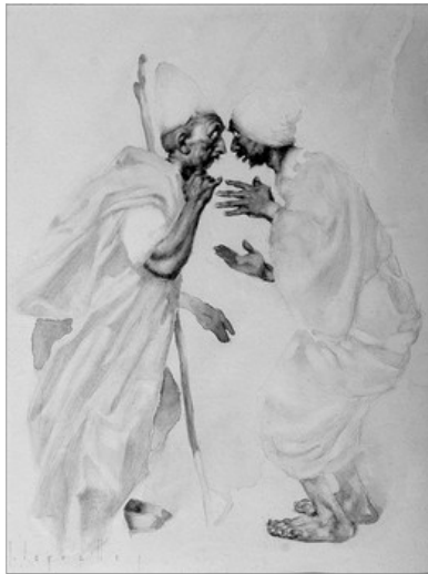
SALIM I SALEM. IL·LUSTRACIÓ DE LES MIL I UNA NIT DE JOSEP SEGRELLES

Llavors se dedicà a recorre les ciutats disfrassat de pastor i jamai escoltà la menor murmuracio contra ell. I succei que tambe el califa de Ranchipur sentia els mateixos temors i realisà les mateixes averiguacions, sense trobar a ningú que criticara la seua justícia.