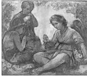
CHIQUETS BERENANT, DE JOAN BATISTE PORCAR

"Esme tame vesme prame vullcme ame narne alme cime neme".