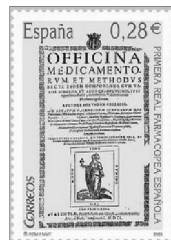
SAGELL DE 2005 COMMEMORATIU DE LA PUBLICACIO DE LA OFFICINA MEDICAMENTORUM