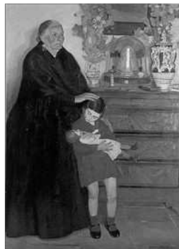
YAYA I NETA. DE RAFAEL ESTELLES BARTUAL

Si el menut encerta l'objecte, se'l premia en un beset, i si pel contrari no l'encerta, se li pega un calbotet.