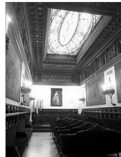
SALO DE LA REINA