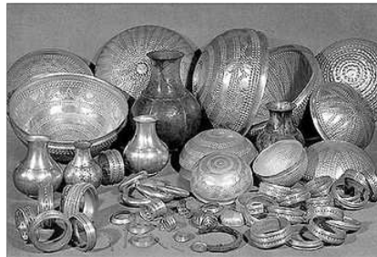
TESOR DE VILLENA

El Tesor de Villena es un dels mes importants descobriments arqueològics de peces en or de la Edat del Bronze europea. En octubre de 1963, en Villena , capital de la comarca del Alt Vinalopo , i en el solar d'una nova edificació del nucli antic, se trobà fortuïtament, entre la grava que anava a ser utilitzada en l'obra, un braçalet d'or de 500 grams de pes. L'obrer de vila que el trobà i el capataç al que l'entregà pensaren que es tractava d'una peça de maquinària, per lo que transcorregué algun temps abans de que algú la duguera a un joyer. Este immediatament informà a l'arqueòleg José María Soler García , Comissari Local d'Excavacions Arqueològiques del Ministeri de Cultura, el qual, junt en els seus col·laboradors, realisà una excavació arqueològica en el lloc d'a-