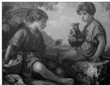
CHIQUETS PINTATS PER JOAN BATISTE PORCAR

Qui pagava, i estava cara la paret, al girar-se senyala ad algu. Si encerta i endevina qui li havia pegat, es canvien el lloc; si no, continua pagant el mateix.