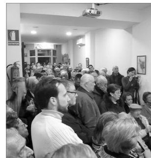
IMAGE DELS ASSISTENTS