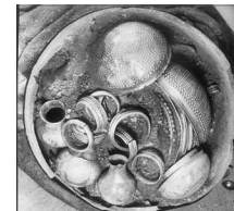
EL TESOR DE VILLENA TAL COM APAREGUE

La col·lecció arqueològica del Tesor de Villena, fon declarada Be d'Interés Cultural el 1 d'abril de 2005.