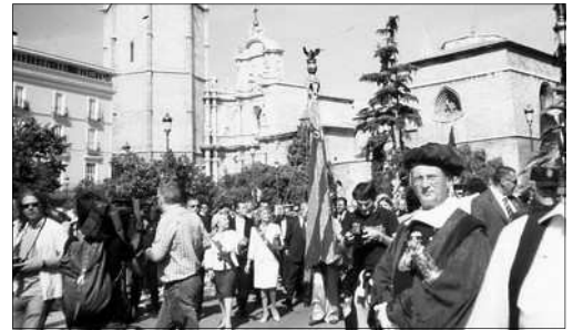
LA REAL SENYERA AL SEU PAS PER LA PLAÇA DE LA REINA. 9 D'OCTUBRE DE 2005

15 Oct (dilluns) Seu de LRP Començament de les classes dels LVIII CURSOS de Llengua i Cultura Valencianes.