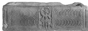
SARCOFEC DE "SANT VICENT MARTIR" Conservat en el Museu de Belles Arts de la ciutat de Valencia.