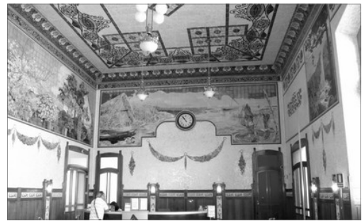
ESPAI DE L'ANTIGA CAFETERIA

Este edifici fon declarat Monument Historic Artistic en 1961 i BIC en 1983. Des de 2004 l'estacio es gestionada per Adif .