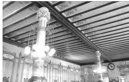
TRESPOL DEL VESTIBUL

Molt ricament decorat apareix també l'interior, lo que correspondria al vestíbul, d'elegants proporcions, cobertes les dos tramades per un trespol en les tradicionals viguetes de fusta