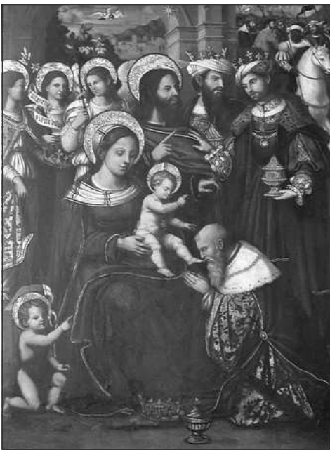
L'ADORACIO DELS MACS, VICENT MACIP. MUSEU LLADRÒ

En pau i harmonia chiquetes, cantem, al fill de Maria naixcut en Belem.