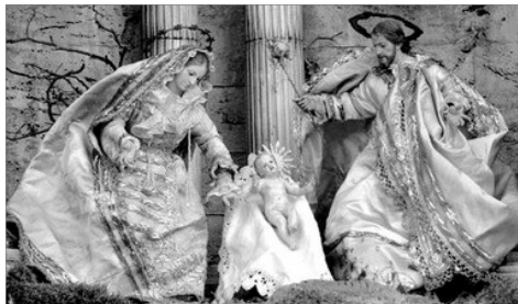
DETALL DEL BELEM

Carles III encarregà noves figures a artistes i escultors d'entre els que destaquen els valencians Josep Esteve Bonet i Josep Ginés , i el murcià Francisco Salzillo . Josep Esteve realitzà mes de cent figures d'uns 50 cm, elaborades en fusta de perera i de