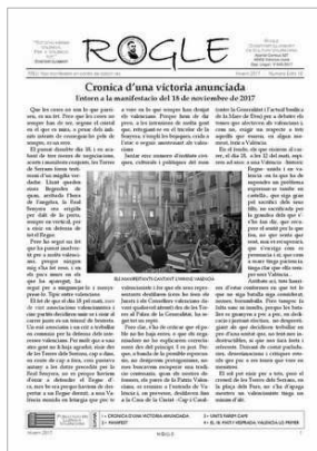
ROGLE EXTRA DEDICAT A LA MANIFESTACIÓ DEL 18 DE NO- VEMBRE DE MATI