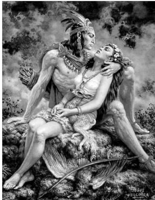
ILUSTRACIO DE JESUS HELGUERA

princesa Iztaccíhuatl que el seu amat havia mort durant el combat. Abatuda per la tristeia, se negà a menjar i als pocs dies muigüe de pena.