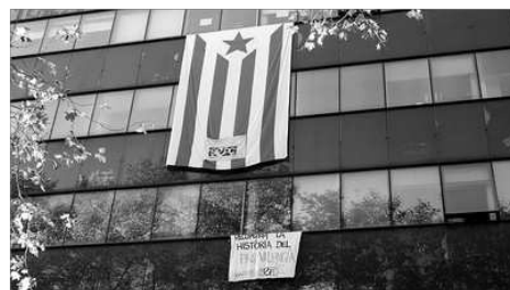
ESTELADA CATALANA PENJADA PEL SINDICAT D'ESTUDIANTS DELS PAÏSOS CATALANS EN LA FACULTAT DE FILOLOGIA DE L'UNIVERSITAT DE VALÈNCIA EL 8 D'OCTUBRE DE 2014.