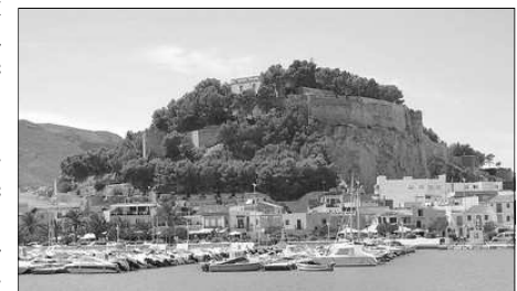
CASTELL DE DENIA