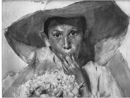
CHIQUET MENJANT RAÏM, DE JOAQUIM SOROLLA

Guanya qui mes “molletes” (pedretes, cigrons...) arreplega.