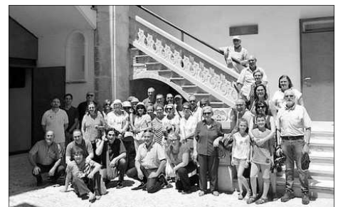
FOTO DE GRUP EN EL PALAU DE LA VILA D'ONTINYENT

Complit el programa, que se desenrollà en un ambient de cordialitat, iniciarem el retorn i donarem per finalisada una jornada que fon intensa i alhora enriquidora.