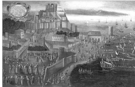
EMBARCAMENT DE MORISCS EN EL GRAU DE DENIA, DE VICENT MOSTRE (1613)

Del patrimoni de Denia mencionarem el castell , d'època islàmica en intervencions posteriors, que alberga el Museu Arqueològic ; el ajuntament , d'estil neoclàssic; les iglésies de l'Assunció, de Sant Antoni i de Sant Miquel; la Torre del Gerro ; tres ermites de reconquesta , del sigle XV, Santa Paula, Santa Llúcia i Sant Joan (Monument Històric-Artístic), a més de l'ermita del Pare Pere, en les faltes del Montgo. El Museu Etnològic i el Museu del Joguè completen una oferta en la que no s'ha d'oblidar el passejar pels carrers típics, que conserven el sabor d'uns altres temps.