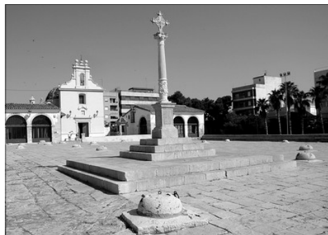
VISTA DEL PATI DE LES SIGES

(Articul original publicat en el fulllet "Burjassot" de l'activitat de Convencio Valencianista "Tots els dies 9", juliol de 2016.)