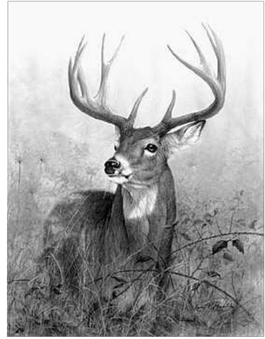
CERVO. DE LARRY K. MARTIN

—il eixos socoltres —afegi— no han netejat ni les taranyines! I mentres seguia examinant-ho tot, va vore sobreixir d'entre la palla les puntes d'una cornamenta. Llavors, crida per vindre un atre home a revisar l'estable, que pareix que te cent ulls, i fins ad eixe moment, no pots estar segur.