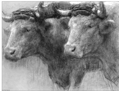
CAPS DE DOS BOUS. DE LEON AUGUSTIN LHERMITTE

Un cervo perseguit per una currica i enemic? cego pel terror del perill en el que se trobava, aplegà a una granja i s'amagà entre unes palles en un cobertí per a bous mansos. Un bou amablement li digue: —iOh, pobra criatura! ¿Per qué d'eixa forma has decidit arruïnar-te i vindre a confiar-te a la casa del teu