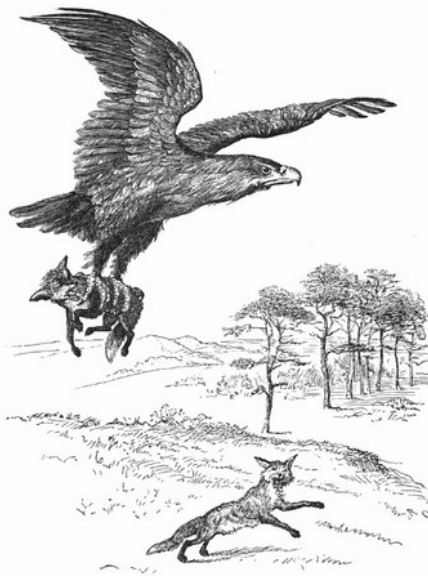
IL·L·STRACIO DE RANDOLPH CALDECOTT (GRAVAT DE J.D.COOPER), 1883

Hague de conformar-se en l'usual consol dels debils i impotents: malair des de llunt al seu enemic.