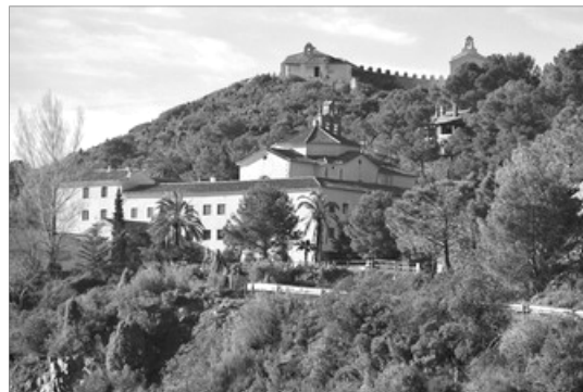
VISTA DEL MONASTERI

L'iglesia presenta planta de creu llatina. La majoria dels elements que la conformen estan plens del simbolisme de les ensenyances i la vida de santa Teresa, a la qual està dedicat el convent. En la capçalera de la nau se troba el sagrari, indicant que Crist es el Cap. La nau se cobrix per voltes de cano que confluen en el