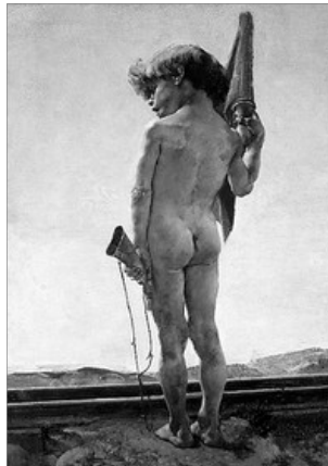
EL GUARDAVIA, D'IGNACI PINAZO

Se repetix intentant que tots siguen macs per tandes.