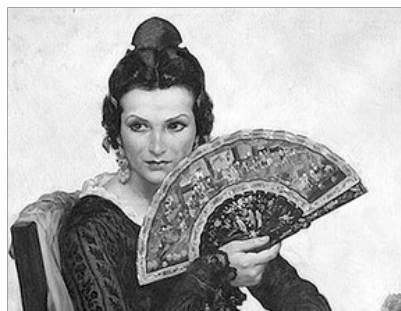
RETRAT DE VALENCIANA EN PALMITO (DETALL), DE LLUÍS DUBON

en l'orige del palmito, be fora este fix, plegable sobre si mateix (paipai) o plegable sobre un eix o clau, el qual inventaren en el segle VII. Hem d'arribar a l' Edat Mija , i sobretot al regnat de Pere II el Cerimoniós , per a tindre notícies del palmito en Valencia al fer este rei requeriment per a que se l'in proporcionaren. Tambe en l'epoca de Marti l'Huma (principis del s. XV) hi ha notícies sobre la seua fabricació. Des del segle XVI i XVII en son moltes les obres pictoriques (retrats de reines, infantes o dames de la noblea) que deixen constancia del palmito com a un articul del qual se solen acompanyar. Se conserven molts eixemplars del segle XVIII elaborats en diferents mate-