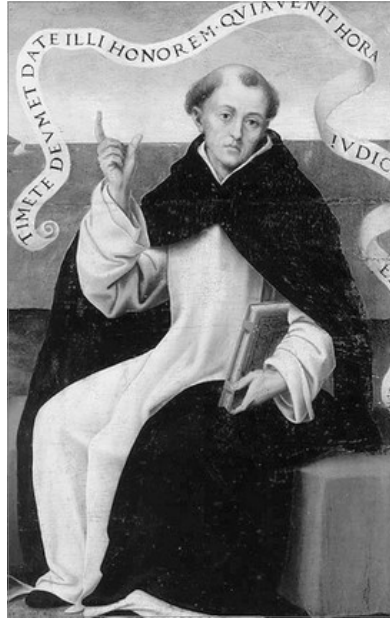
SANT VICENT FERRER (DETALL), DE JOAN DE JOANES

En la llengua valenciana i en amor pur i sincer vostre poble vos aclama; (Bis) iVixca Sant Vicent Ferrer!