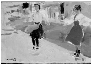
BOTANT A LA CORDA, DE JOAQUIM SOROLLA