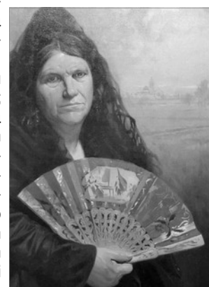
LA COMARE DE FOYOS (DETALL), D'ANTONI FILLOL

els hi ha de diferents tipologies en funció del tamany i la funcionalitat, els quals se coneixen en els noms de: baralla, pericona, semipericona, isabeli, de blonda, per a chiquetes (per a menuts), per a cavaller, de recòrt, miniatures, etc.