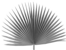
FULLA DE PALMITO. PLANTA CHAMAEROPS HUMILIS

La paraula palmito l'usem per a designar l'objecte que aprofita per a aventar-se; este terme es l'usual en llengua valenciana i s'adopta per la seua similitut en la planta del mateix nom, el palmito o margallo . El vocable antic en llengua valenciana es ventall i prové de la paraula llatina ventus > ventar mes el sufix -all ; l'us general d'esta paraula ha quedat reduït en l'actualitat al seu primitiu oríge, un utensili de fabricació mes senzilla (un pal al que s'adossa una lamina de fusta o un altre material mes o manco rígid), que s'utilisa per a