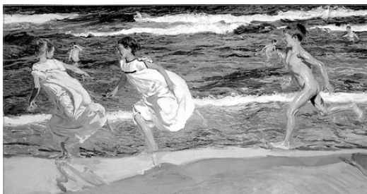
CORRENT PER LA PLAJA, DE JOAQUIM SOROLLA

Dos chiquets, que son els capitans, armats d'un mocador, una correja o un palet, procuraran anar captant el major numero possible de jugadors.