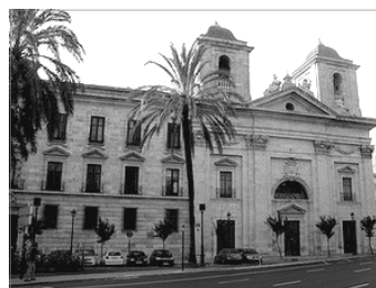
MONASTERI O PALAU DEL TEMPLE. VALENCIA C.

Els monarques varen delegar la seua autoritat en un càrrec nomenat Lloctinent . La situació de l'Orde canvia paulatinament. Ya no hi havia guerres. Els cavallers no corrien riscos ni suportaven fatigues, pero tampoc guanyaven fama. Es convertixen en administradors. L'Orde, netament valenciana, es castellanisa. La corona feya els nomenaments, des del lloctinent fins als retors. Utilisava els seus hàbits per a pagar favors als fills de la nobleza. La vida en el convent transcorria en una confortable me-