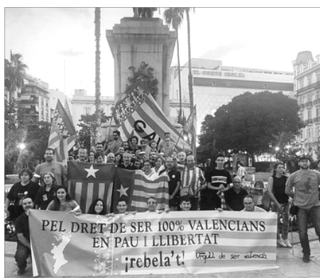
MANIFESTACIO "PEL DRET DE SER 100% VALENCIANS" (09/10/19)