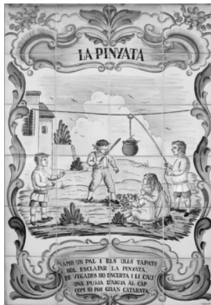
RAJOLS "LA PINYATA". JARDI EL BOSCANY. MANISES

Tots estaven pendents, tant els que tiraven de la corda com el public en general. Si el jugador no conseguia trencar el perol transcorregut el temps acordat, se deixava l'oportunitat a un atre, i aixina fins que algu ho conseguia. Els demes es divertien veent marrar els colps, pero tambe estaven molt atents per a, quan encertara al perol i caiguera el contingut, intentar fer-se en ell, si era bo, o, en cas contrari, apartar-se rapidament.