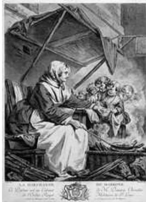
La castanyera, gravat de Jacques Firmin Beauvarlet

El castanyer , arbre que dona el fruit, pot arribar a altures que superen els 30 metres; pertany al gènere Castanea de la família de les Cupulíferes . La seua fusta és molt preada en la fusteria i en la construcció per ser forta i resistent. Els castanyers tenen una llarga vida que, com a promig, sobrepassa els 150 anys i es conéixen eixemplars en més de quatre segles.