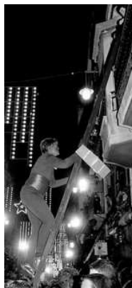
"NEGRE" PUJANT A UN BALCO

D'entre les moltes cavalcates dels Reis Macs que es celebren en els pobles valencians, i també en tot el territori peninsular, n'hi ha una molt especial; es tracta de la cavalcata dels Reis Macs de la ciutat d'Alcoy . Està considerada com la més antiga del món puix es troba documentada des de l'any 1866.