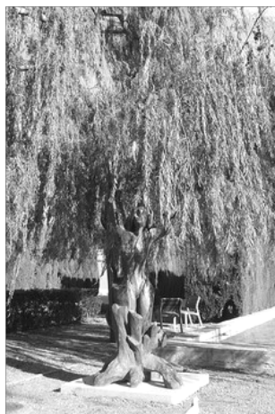
METAMORFOSIS D'ARETUSA CONVERTINT-SE EN SALGUERA

Ladón, fidel guardià, enrollà la seua coa en el tronc de l'arbre i presentà combat a l'intrús, llançant foc i grans veus per les seues cent goles i fum pels seus nassos. Un altre que no fora el propi Heracles haguera fugit esglayat, mes l'hèroe resistí els embats del monstuo i el matà. L'escultor representa la victòria d'Heracles sobre Ladón, clavat contra el pis, convertit en serp, proferint el semideu un fort crit i alçant en la seua mà esquerra, com a signe de triomf, la fruita conseguida.