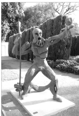
HERACLES/HÈRCULES TRIUMFANT SOBRE EL DRAGÓ