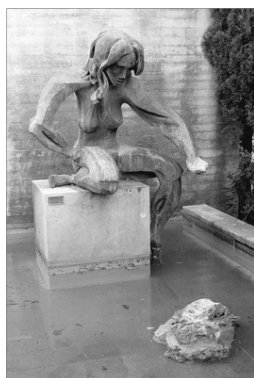
AFRODITA SEMBRANT L'ARBRE

Un altre personage de la nostra història és Heracles (el Hèrcules romà), que fon castigat a complir dotze treballs, l'undècim dels quals era furtar les pomes d'or d'este jardí. No va ser tasca fàcil, perquè ni tan sols sabia a on estava l'illa. Home de tanta voluntat com força, conseguí aplegar al jardí i immediatament, besllumenà l'arbre en les seues pomes d'or.