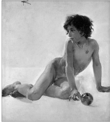
EL CHIQUET DE LA BOLA. DE JOAQUIM SOROLLA

El numero de telles per jugador se pot establir abans de començar. Tambe se pot acordar un numero illimitat, fins que el jugador que agote les seues es quede "fora".