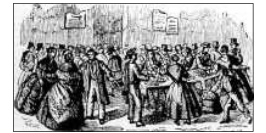
XILOGRAFIA DE 1800 REPRESENTANT UN PORRAT

Els antics diccionaris valencians ya definien els "porrats" com una especie de fires d'aliments en les quals es venien avellanets, armeles i cigrons torrats, albercocs i prunes seques, torro, etc. Estes fires es celebraven al voltant