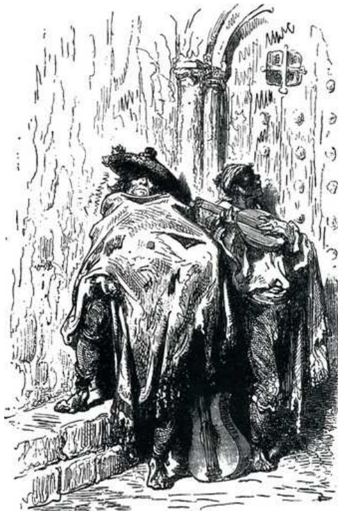
Cegos a la porta de la Seu de Valencia, dibuix de Gustau Doré

- Fills meus, suponc que dedicaréu a Deu una part de les almoines que heveu arreplegat. Digau-me, ¿com penseu donar gracies a l'Altíssim, que en tanta bondat