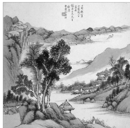
PAISAGE CHINENC, ANONIM (ENTRE 1820 I 1880). MUSEU WALTERS, BALTIMORE, EE.UU.

reta en ma, li explicà tots els racons de la lluntana provincia: els poblats, les