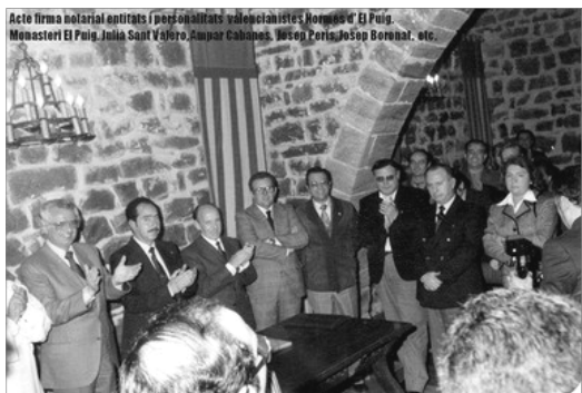
ACTE DE LA FIRMA DE LES NORMES D'EL PUIG, 1981

El segon pas podria ser aconseguir un pacte de concòrdia, estendre a totes les entitats valencianistes el missatge de que no estigmatizaren ni rebujaren cap treball narratiu, poetic o d'investigació que es presente a concurs o certamen lliterari en qualsevol dels dos sistemes d'accentuació.