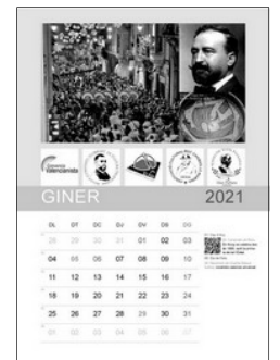
MES DE GINER

Per a fer-se en ell, pot dirigir-se a qualsevol de les associacions citades.