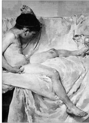
JOCS ICARS. D'IGNACI PINAZO

Era un joc dur perque alguns dels jugadors pegaven la nyespla en ganes, motiu pel qual se reservava nomes per als chics.