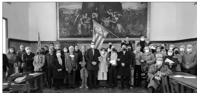
FOTO DE GRUP DELS ASSISTENTS