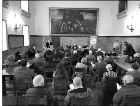
INSTANTANEA DE L'ACTE

a l'unitat, a superar divisions internes i aixina poder afrontar un futur autenticament valencià i conseguir una veu que s'escolte en l'Estat.