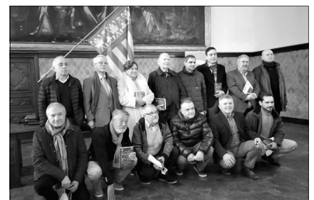
FOTO DE GRUP DELS AUTORS PRESENTS EN L'ACTE

Una visita guiada pel monasteri, en la que participaren la majoria dels assistents, posà la nota final a un mati d'agradable convivència.