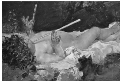
BACO CHIQUET, D'IGNACI PINAZO, 1879

Qui se solte se'n va fora i guanya qui queda.