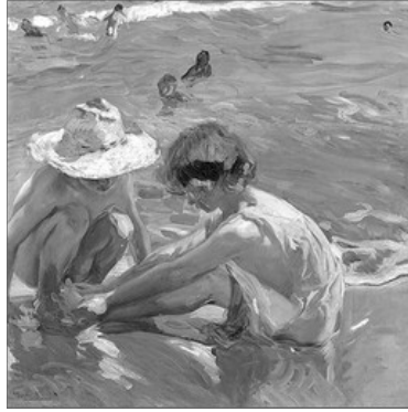
EL PEU FERIT, DE JOAQUIM SOROLLA, 1909

▪ U dels mes divertits es el "mil i ou". Un jugador s'aparta del grup i es tapa els ulls. Qui comença a contar, ho fa rapidament, a partir de l'u i en veu alta, sense senyalar a ningú. Quan al dels ulls tapats se li ocorre diu: "Mil i ou", qui conta se dentindrà i el numero en que s'ha parat servirà per a anar fent recontes en tots els participants i anar triant, lo qual se fa de la següent manera: començant sempre en el mateix jugador, posats tots en una filera (o en rogle), qui porta la direccio comença a contar i se salva a qui li toca el dit numero. L'accio se repetirà fins que quede un participant, l'ultim, que sera qui paga.