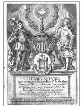
CELEBRE CENTURIA, DE VICENT CARBONELL, 1873