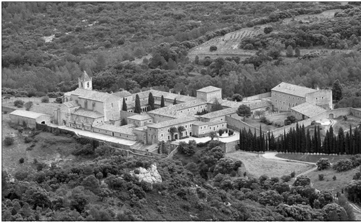
PANORAMICA DEL MONASTERI DE SANTA MARIA

Com s'ha dit, en la construcció predomina l'estil gòtic-cistercenc, encara que presenta elements del romaníc antic en la solució d'algunes portades i capitells. Els elements gòtics que trobem estan en l'estructura de l'iglesia i en el claustre major.