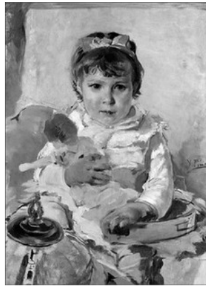
CHIQUETA EN UNA NINA, D'IGNACI PINAZO, ca. 1890

Quan diu en força la paraula "nevarà" ix corrent a pillar ad algu dels que formen el rogle que en eixe moment escampen a correr. Si agarra ad algu, este paga i fa de pastoret. Repetint-se el joc fins a que se cansen.