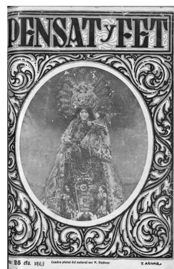
PENSAT I FET, NUM. 16. MAIG 1923