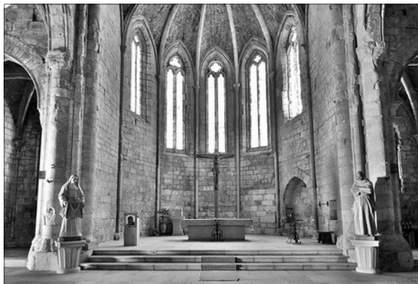
INTERIOR DE L'IGLESIA

A la dreta de l'entrada se troba el conjunt monastic que s'ordena entorn al claustre major . Te una plataforma d'a on arranquen una serie de columnes pars, alternades en pilars, damunt els quals naixen els arcs apuntats de doble canaladura (estries). Els capitells i les llinees d'imposta estan decorats en motius vegetals i rosetes, combinats en motius figuratius i d'animals. Damunt dels arcs hi ha uns oculs que favorixen l'alluminament de les galeries. En una part del claustre se situa la cuina, el refectori i unes atres dependencies. En l'atra banda, la sacristia vella i la sala capitular (segle XIV). Esta ultima es de planta rectangular dividida en dos trams per un arc sostingut per mensules. S'accedix per mig d'una porta ogival trilobulada flanquejada per finestrals.