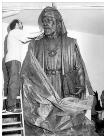
L'ESTATUA DE VINATEA EN EL TALLER DE L'ESCUPTOR.