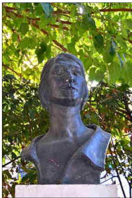
BUST EN EL MONUMENT A NINO BRAVO. CARRER LLEIDA. VALENCIA CIUTAT

En el cas de Nino, m'atreviria a dir: "Si vols conèixer els secrets d'un cantant universal, pensa en tèrmens d'energia, potència i vibració." Només aixina podria explicar el perquè nos arriba i nos ompli tant Nino Bravo.