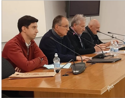
INSTANTANEA DE LA PRESENTACIO

La presentacio tingue lloc en el salo d'actes del Museu de la Ciutat , en el cap i