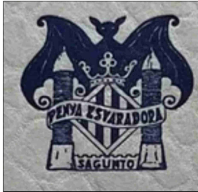
ESCUT DE LA PENYA ESVARADORA