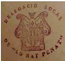
LA PENYA ESVARADORA COM A DELEGACIO DE LO RAT PENAT EN SAGUNT