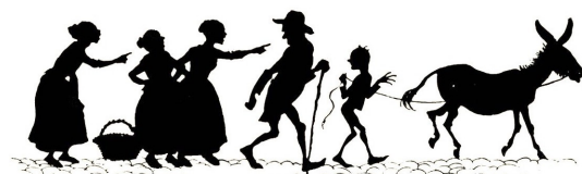
IL·LUSTRACIONS D'ARTHUR RACKHAM

—iMiren quin parell de bambaus! Tenen un burro i, en conte de montar-lo, van els dos caminant al seu costat. Per lo manco, el vell podria pujar-se al burro.