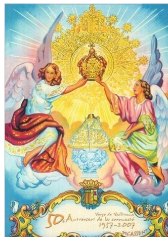
ESTAMPA COMMEMORATIVA DEL CINQUANTENARI DE LA CORONACIÓ