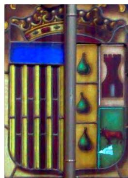
REPRESENTACIÓ DE L'ESCUT DE PICASSENT EN EL DISSENY DE 1957

cuarteles representándose en el primero tres peros de sinople sobre campo de oro y en el segundo, a la parte superior, un castillo de gules sobre campo de plata y en el inferior un toro de gules mirando a la izquierda sobre campo de sinople.