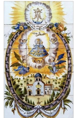
MOSAIC CERÀMIC REPRESENTANT LA VERGE DE LA VALLIVANA