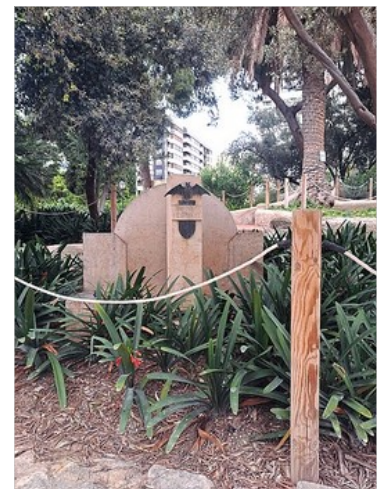
IMAGE ACTUAL DE L'EMPLAÇAMENT DEL MONUMENT