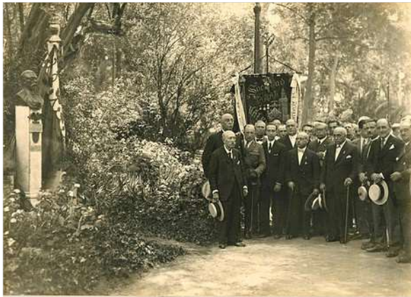
INAUGURACIO DEL MONUMENT, 1928

Ixcà se done una solució ràpida i digna.