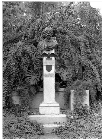
IMAGE DEL MONUMENT ORIGINAL