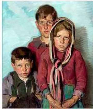
CHIQUETS VALENCIANS, D'ENRIQUE GARCÍA CARRILERO

El joc acaba quan tots els lladres estiguen detinguts. En cas de voler continuar jugant, ara es canvien les tornes, es dir, que els que eren polis ara son cacos; i se pot canviar d'amo, be per sorteig, be per eleccio. L'amo te la potestat de dirigir el joc, o parar-lo si se cometen faltes o trampes.