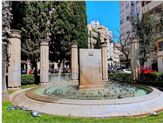
MONUMENT EN L'AVINGUDA REGNE DE VALÈNCIA. VALÈNCIA CIUTAT

Les característiques del monument en la Memòria Descriptiva se definien aixina (traduïm al valencià): L'estela es un bloc de pedra rectangular, treballada de cantereria en algunes cares i aristes. De dimensions 1,29 m d'ample frontal per 0,30 de grossària i 2 m d'altura, i anirà empotrada... en un basament de pedra de la mateixa qualitat... En l'exterior de la font en un traçat semicircular i en zona ajardinada, se dispondrà una vegada restaurades, cinc