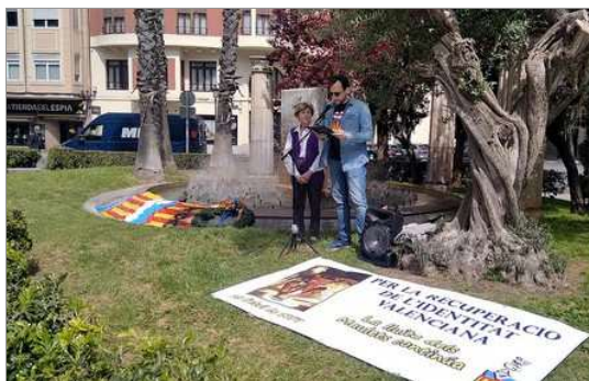
INSTANT DE L'HOMENAJE ALS MAULETS DE 2024. ORGANISAT PEL GAV (27-4-24)

El bloc de pedra treballada instal·lat en el centre duria la llegenda que ya s'ha indicat. A la dreta del monument petreu una centenària olivera, u dels arbres mes llongs, resistents i fructífers, símbol de la resistència al pas del temps i de la de les gents valencianes i símbol de sa consciència identitària, i a l'esquerra, cinc enormes columnes blanques que representen els deu símbols (dos per columna) del protocol nobiliari que te la Ciutat , cap del Regne de València , i que compartix en la Real Senyera: molt noble, il·lustre, egregia, magnífica, insigne, inclita, magnànima, fidel, coronada i dos voltes lleal”.