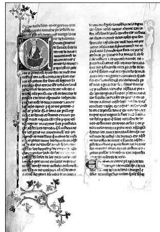
INTRODUCCIO ALS FURS DE JAUME I