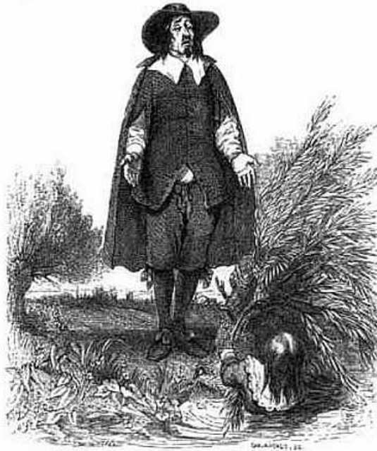
Ilustracio de la faula de Jean Jacques Grandville

-iMira quin ravachol! iA on l'ha portat la seua follia! iOcupa les teues hores cuidant ad esta classe de prole! iPobres pares, pobres d'ells cuidant en tot moment ad esta caterva incontrollable! iQuant deuen de patir; còm llamente el seu destí!