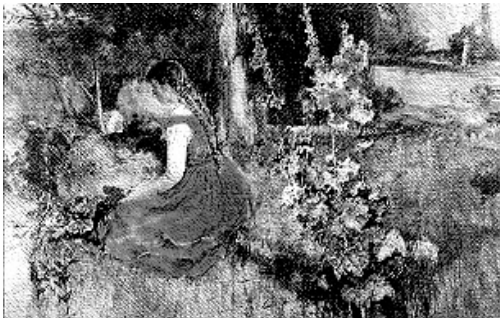
Chicona en el camp, obra de Joaquim Sorolla

voltes descobria molt satisfeta algun cau de conills, o les traces dels javalins. Pero lo que li produia mes plaer era sentir el cant dels pardalets: unes vegades, monoton com el dels vilers , unes atres, variats, tendres, harmoniosos, com els dels gafarrons , cagarneres , rossinyols o merles , a vegades acompanyats del grall d'un corp que revolotejava buscant animals morts. Lo que mes li encantava era tocar