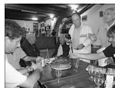
POC DURÀ ESTE CREMAT

Un valencianisme renovador s'està gestant i encontres com el del Penya- golosa poden ser una via per a que la llavor comence a donar fruits.