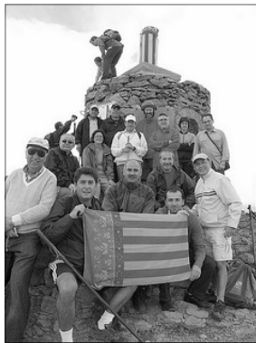
ALGUNOS DELS ASSISTENTS EN EL CIM DEL PENYAGOLOSA

La Cardona poguerem aconseguir la meta fixada es- Vives , per capant de les seues inclemències. segon any Dinarem en St. Joan, i a continuació consecutiu, es realisaren diferents parlaments, que convocà el II començaren en un sentit recòrt per Aplec Valencianiste , un l'any nos han deixat. Les intervencions dia de convivència entre tots aquells valencianistes que durant generaren un debat centrat en la qües- tio mes preocupant en el moment ac- tual: ¿Per qué no s'unix el valencianis- me i acaben les divisions que impe- dixen afrontar un camí que el conduïxca a una major presència i influència en la societat?