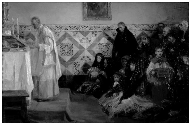
Oint missa, Rocafort, obra de Josep Benlliure

se'n va anar a l'iglesia a dir missa major, sense donar-li instruccions a l' assistenta sobre lo que havia de preparar per al dinar. La famula va anar a l'iglesia a preguntar-li-ho al seu amo quan la funcio ya havia començat, per lo que se va parar drete ta al cancell , que estava obert, i alli