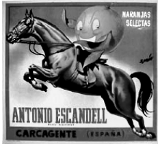
ETIQUETA D'UNA MARCA DE TARONGES

Ara, en est article, i per a documentar al lector sobre l'importància que ha tingut en les darreres 4 o 5 dècades aquella primera acció, tan llunyana en el temps, sobre l'implantació d'horts de tarongers en el nostre Regne, anem a constatar que en la major producció espanyola obtinguda en tota la seua història, la campanya 2002/2003, incloent clementines, llimes i pomes, sobrepassaren els 6.000.000 de tonellades, de les quals 3.767.000 n'eren valencianes; és dir, un 61,40% de la totalitat.