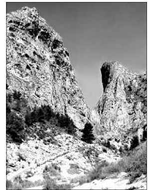
BARRANC DEL CINT, ALCOY

Te una orografia molt variada, mes suau en la part sud-occidental i mes agrest en la nord-oriental; en esta última es troben molts cims de mes de 1000 metres, destacant els 1389 del Montcabrer.