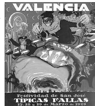
PRIMER CARTELL DE FALLES DE VALENCIA

Mestre del dibuix, treballà múltiples tècniques, des del gouache fins a l'oli, sent insuperable en l'aquarela; en elles creà un mon particular d'atmosferes suggerents posades al servici d'una desbordant imaginació.