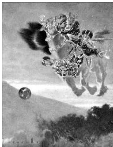
IL·LUSTRACIO DE LES MIL I UNA NITS

Influenciat per les obres del gravador Gustau Doré , en 1909 comença la seua carrera artística com a il·lustrador. En els següents anys treballa per a diverses editorials barcelonines, principalment per a Araluce , il·lustrant obres de la literatura universal adaptades per als chiquets. El prestigi que adquirix fa que reba, en 1918, l'important encàrrec d'il·lustrar El Quixot , obra que constituïx