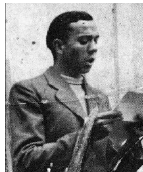
MIGUEL HERNÁNDEZ RECITANT UN POEMA.

El falliment, als pocs mesos d'edat, de son primer fill (1938) i el naixement del segon (1939) s'afegiren com a motiu inspirador de la seua obra poètica Hijo de la luz y de la sombra , dedicada al primer fill, i Nanas de la cebolla al segon.