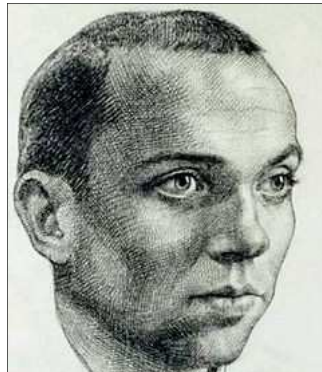
RETRAT DEL POETA FET PER ANTONIO BUERO VALLEJO EN LA PRESO EN 1940.

esta etapa iniciaria la que ha segut considerada com la seua obra mestra: El rayo que no cesa , composta per versos –sonets endecasílaps– en els quals el fill conductor son els temes dedicats a l'amor, la vida i la mort. La