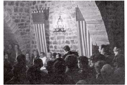
ACTE D'ADHESIO EN EL SALO DE SENYERES

En motiu de celebrar-se el 30 aniversari de l'Acte d'Adhesió a les Normes d'El Puig, la federació d'entitats Accio Cultural, Social i Econòmic del Regne de València (ARV) , junt en la Plataforma Normes d'El Puig , ha organitzat una sèrie d'actes per a commemorar aquell fet que supongue el "retorn a la fidelitat a la Patria", en paraules de Miquel Adlert Noguerol, en lo que a normativa ortogràfica per a la llengua valenciana representava.