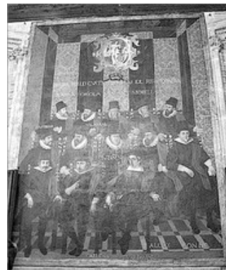
REPRESENTACIÓ DE L'ESTAMENT REAL PALAU DE LA GENERALITAT

noblea i el clero se resistien a l'implantació dels Furs en tot el Regne, per lo que, en les Corts de 1323-24 , se comprometeren a acceptar-los a canvi de que se respectaren les seues jurisdiccions de senyoriu.