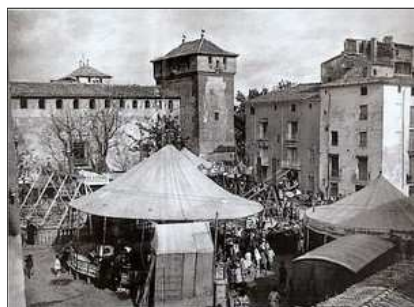
IMAGE ANTIGA DE LA FIRA DAVANT DEL PALAU COMTAL

Casi 100.000 metres quadrats, mes de mig miler de visitants i un complet programa d'activitats convertixen esta fira en una cita obligada de la primavera d'hivern valenciana.