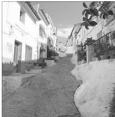
CARRER DE LA CORBELLA. CENTRE HISTORIC D'OLIVA

L'orige d'esta festivitiat se troba en l'Edat Mija, época en la que eren molt freqüents les intoxicacions produïdes per menjar seguit pa de centeno, el