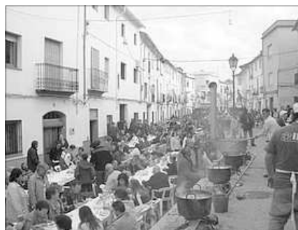
LES CALDERES AL FOC

El dia 17, festivitiat del Sant, durant tot lo dia es celebrarà el Porrat de Sant Antoni; i fins a l'any que ve. O, mes be, fins al 3 de febrer, festivitiat de Sant Blai , que, encara que en no tanta força, te el seu propi porrat en Oliva.