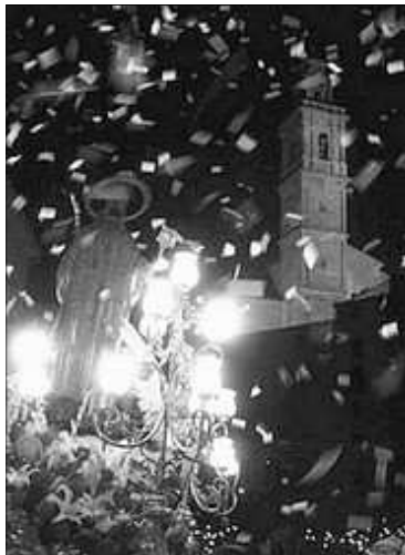
PLUJA DE PAPERS SOBRE SANT BLAI

El següent dels actes es L'Entrada , que es celebra la vesprada del dia 2 de febrer. Pel mati se procedix a l'hissat de les banderes, el cant de l'himne de Bocairent i la presentacio de les bandes de musica que acompanyaran per la vesprada, pels carrers de la localitat, a les filaes . Les cinc filaes cristianes i les quatre mores desfilaran en tota la seua fastuositat (trages, banderes, estandarts, cavalleries) al ritme d'alegres passodobles els primers, i en emotives marches i al so de timbals les filaes mores.