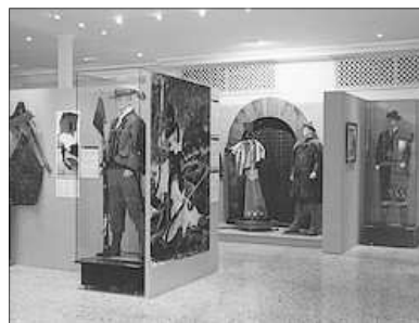
MUSEU DE LA FESTA

les filaes , acompanyades dels seus capitans, visiten l'ermita a on se celebra la tradicional Missa d'Accio de Gracies . Al finalisar se fa l'escenificacio, per part del Embaixador moro, de l'emotiva Despujla del Moro , acte de conversio a la religio cristiana.