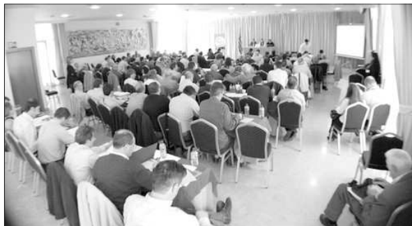
PANORAMICA DE LA SALA

Hui, mes que mai, des de la llibertat, des del dret que nos assistix a seguir sent Poble Valencià , volem felicitar als iniciadors d'este camí, i els emplacem a que no tarden en pujar el segon escaló, i el tercer, i el quart... i aixina successivament fins a contribuir a que el nostre poble torne a sentir l'orgull de ser valencià. A nosatres, com a Rogle , si es aixina, segur que nos trobaran; es mes, estarem treballant com el qui mes. ¡Felicitats i benvinguda Convenció Valencianista.Valencianisme2012!