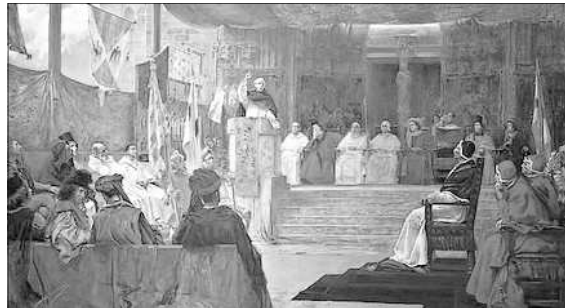
EL COMPROMIS DE CASP. DE SALVADOR DE VINIEGRA

L'elecció no fon gens fàcil puix hi havia molts interessos en joc. A pesar de la forta pressió catalana a favor de Jaume d'Urgell , a la fi resultaria elegit, probablement, qui menys s'esperava, Ferran