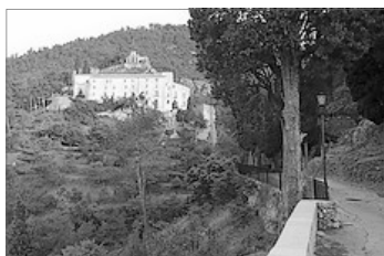
VISTA DEL SANTUARI DES DEL CAMÍ D'ACCÉS

Per a confirmar la participació o obtenir informació més detallada, podran dirigir-se als organitzadors per mig dels correus: rogleconstantillombart@gmail.com ; info@valencianisme2012.com ; o del telèfon: 622 879 341 .