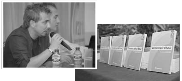
DOS INSTANTANEEES DE L'ACTE

Per a mes informació sobre la nova associació pot contactar per mig del telefon: 622 879 341 o del correu: info@valencianisme2012.com .