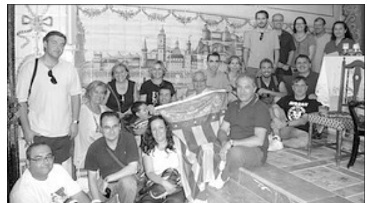
ALGUNES DELS PARTICIPANTS DAVANT DEL FAMOS RETAULE DE L'INCENDI D'ALACANT

En acabar el dinar a l'ombra del Santuari-Convenc de Santa Maria , tinguerem l'oportunitat de visitar-lo. La guia local nos feu una ampla explicació sobre l'advocació, el proces de construcció, les interessants romeries que partixen de les diferents localitats de la comarca, i els rics tesors ceràmics que conserva.