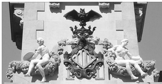
FRONTERA DE L'AJUNTAMENT DE VALENCIA (DETALL)

Acabada la Guerra Civil, encara que afectat per unes catarates, es centra mes si cap en el seu treball. Es l'epoca de l'imaginaria religiosa; per mencionar alguna obra recordem el Crist Jacent de Ontinyent o la Mare de Deu de la Seu de Xativa . En Crevillent , Cartagena , Malaga , Conca , Hellin , Salamanca ..., es poden contemplar treballs seus.