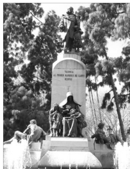
MONUMENT AL MARQUÉS DE CAMPO. VALENCIA CIUTAT

En el Centre del Carme a partir del 7 de setembre s'exhibirà una mostra en la que se confrontaran les obres de Benlliure i de Joaquim Sorolla al fil de l'amistat que els unia.