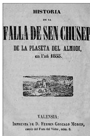
PORTADA DEL PRIMER LLIBRET DE FALLA

Este primer llibret consta de 14 pàgines impreses, de 11,5 x 16,00 cm, un gravat en la portada i un altre al final, junt a l'Epitafi. Va ser impressa en l'impremta de D. Fermín Gonzalo Morón , carrer del