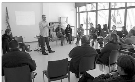
IMAGE D'UNA DE LES SESSIONS

Convenció Valencianista ya està preparant un proxim encontre formatiu, que es desenrollarà, segurament, el proxim setembre, i en el que continuarà abordant-se la tematica del municipalisme com a instrument de participació ciutadana, i unes altres qüestions tan importants com l'honoradea, l'honestitat, la bona gestió, etc. en el treball quotidià dels representants públics.